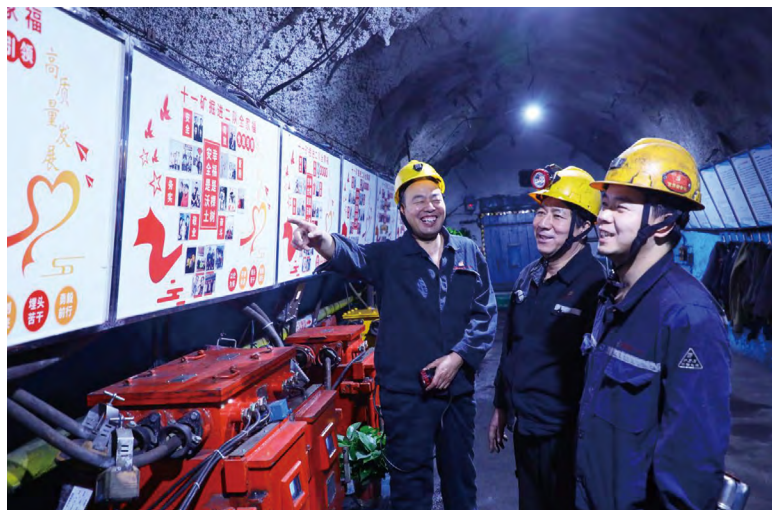
▲职工观看巷道里的“全家福”

坚持“三个聚焦”，推动思想政治工作走深走实。聚焦日常、聚焦文化、聚焦民生，增强思想政治工作针对性实效性。一是聚焦日常。坚持把思想政治工作渗透到企业各项工作全过程，持续开展党支部书记“三进”（进区队、进班组、进家庭）、“党员包保职工”、“六必访七必谈”等活动，增强职工工作亲和力感染力。二是聚焦文化。坚持把思想政治工作与“家文化”建设、精神文明创建紧密结合，深入开展“出彩十一矿人”“年度十大新闻”等评选活动，使职工学有榜样、赶有目标。大力弘扬传统文化，叫响“书画艺术、舞龙舞狮、戏迷擂台赛、消夏活动”四大品牌，不断提升企业软实力。三是聚焦民生。坚持把思想政治工作与解决职工实际问题相结合，践行“企业发展，职工共享”理念，投用“井下空调”，集中办好职工关心的民生实事，用好“EAP心理疏导”，培育职